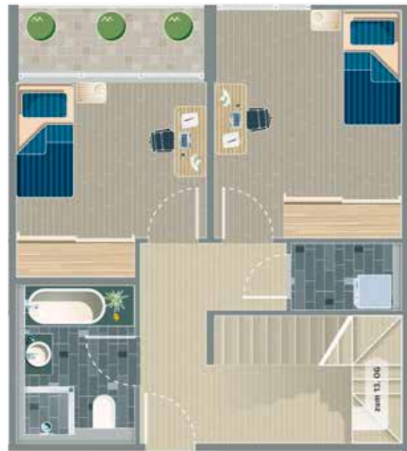
12. OG ▲

Das kann man mieten: Apartments über der Stadt. Mit ganz besonderem Feeling. Diese Apartments bieten Ihnen eine perfekte Grundlage zur Verwirklichung Ihrer Wohnideen. Gestalten Sie Ihr Glück in Ihrem neuen Zuhause.